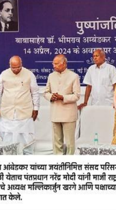
भारतरत्न डॉ. बाबासाहेब आंबेडकर यांच्या जयंतीनिमित्त संसद परिसरात आयोजित कार्यक्रमामाठी येताच पंतप्रधान नरेंद्र मोदी यांनी माजी राष्ट्रपती रामनाथ कोविंद, काँग्रेसचे अध्यक्ष मल्लिकार्जुन खरगे आणि पक्षाच्या नेत्या सोनिया गांधी यांचे स्वागत केले.